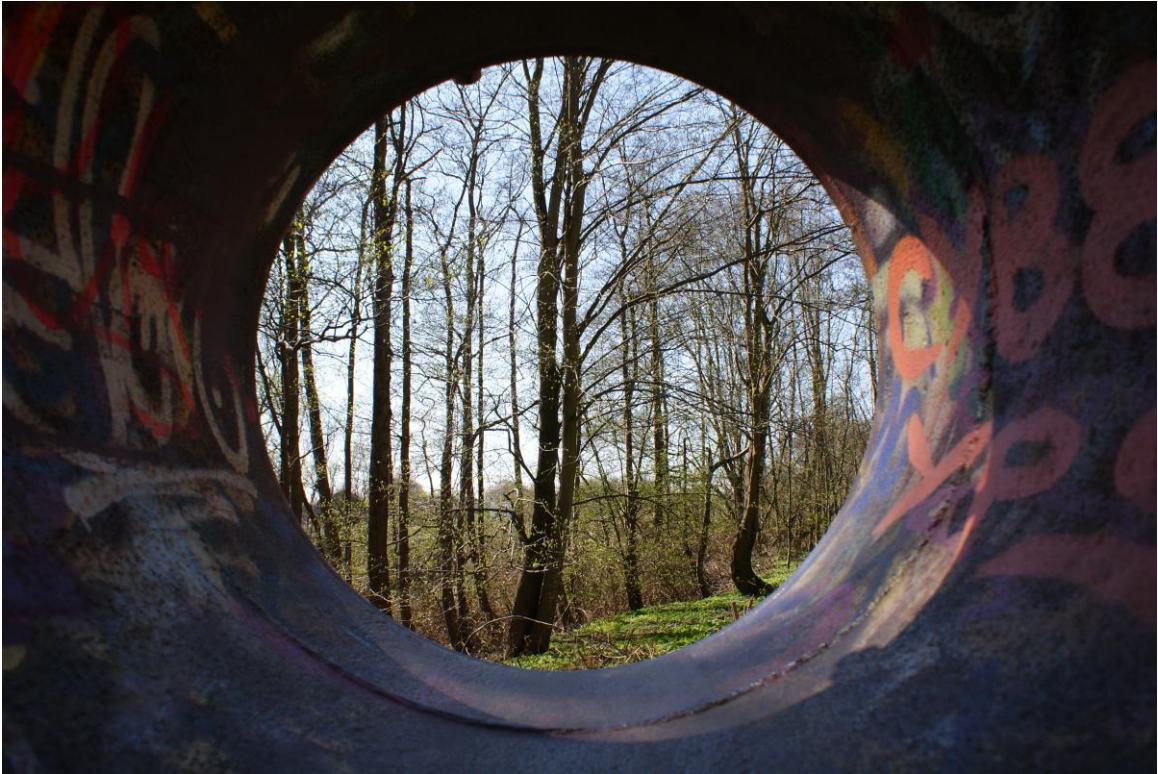
Katrin Meinhardt, Hamburg

Das Bild ist schon vor längerer Zeit (2010) in Itzehoe entstanden. Es symbolisiert, dass die Zeit der Depression wie ein langer enger Tunnel wirkt. Es gibt keine Wege rechts und links davon. Dies zeigen auf dem Foto die doch recht scharfen Abgrenzungen und Linien. Doch irgendwann gelangt man an den Punkt, an dem man sich bewusst wird, dass es auch ein Leben nach der Depression gibt. Man steckt weiterhin in diesem Tunnel, aber mit Blick und Gedanken an das Leben danach. Was auf diesem Foto die Helligkeit, die Schatten, der Himmel und die Bäume symbolisieren. Dass die Bäume kahl sind, symbolisiert, dass man zwar weiß, dass es ein Leben nach der Depression gibt, aber noch keine klare und „bunte“ Vorstellung davon hat bzw. haben kann.