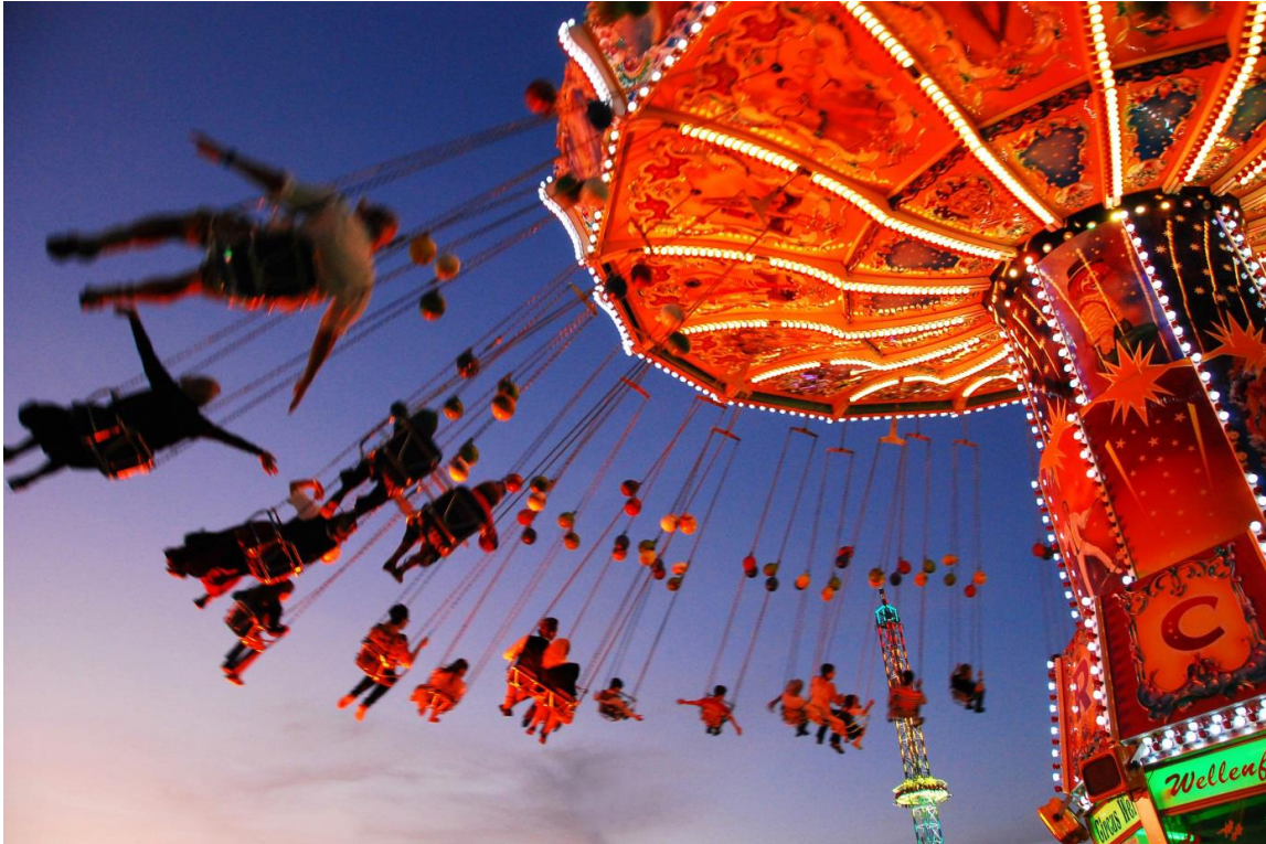
Markus Bundschuh, München

Das Foto wurde 2011 auf dem Oktoberfest in München aufgenommen und zeigt die Unbeschwertheit der Menschen im farbenfrohen Lichterglanz des Kettenkarussells bei Ihrem „Flug ins Blaue“.