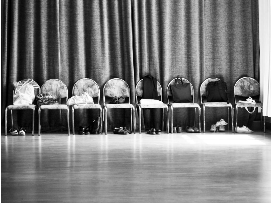
Sibylle Kölmel, Leipzig

Das Bild entstand im Rahmen einer Reportage über eine Ehrenamtliche, die (noch zu DDR-Zeiten) einen Gesprächskreis für psychisch kranke Menschen mit begründete, lange begleitete und später einen Tanzkreis aufbaute, in dem – seit nunmehr 17 Jahren – psychisch Kranke mit „Gesunden“ einmal in der Woche für anderthalb Stunden zusammen tanzen.