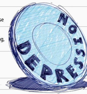
Abb. 2: Die psychosoziale und körperliche Seite der Depression, zwei Seiten der gleichen Medaille