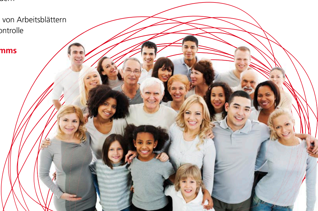
Alle auf den Bildern dargestellten Personen sind Modelle.